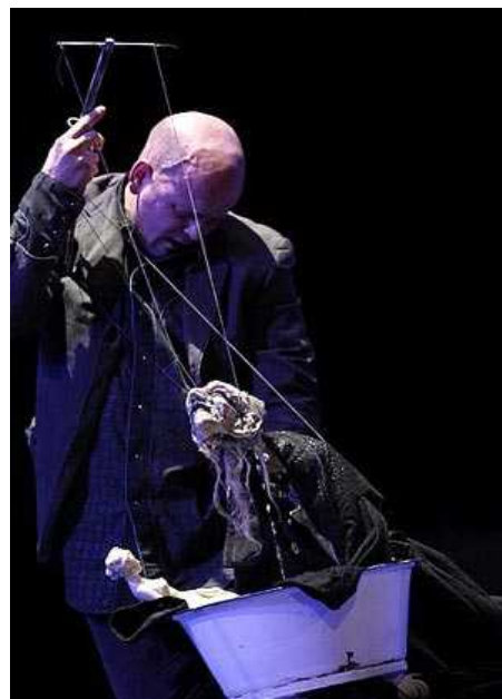
Figurentheater Wilde&Vogel, „Faust spielen“