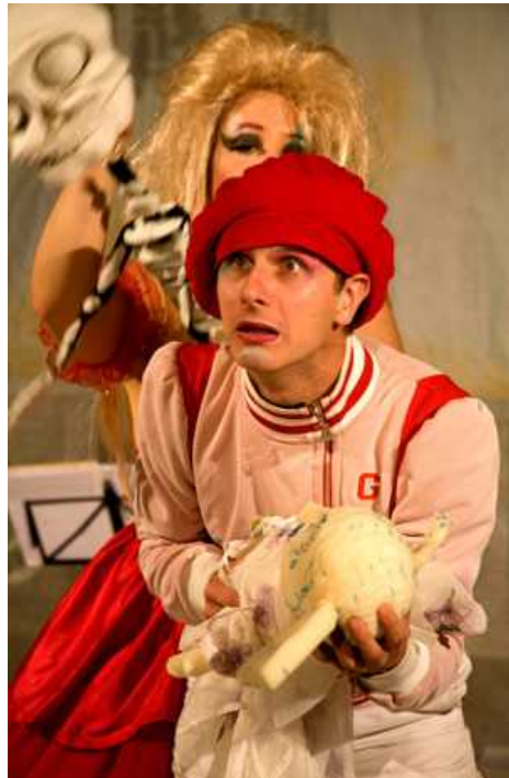
Flunker Produktionen „Der Tod und das Mädchen“

Freie Professionelle Theaterensembles sind hoch bewegliche künstlerische Einheiten, die schnell und reibungsarm auf Bedürfnisse und neue künstlerische Strömungen reagieren können. Angesichts der finanziell angespannten Situation der öffentlichen Hand wird sich in den nächsten Jahren dringlich die Frage stellen, wie die bestehende Struktur 'fester' Stadt-, Landes- und Staatstheater mit diesem innovativen Kunstsektor zu verknüpfen ist.