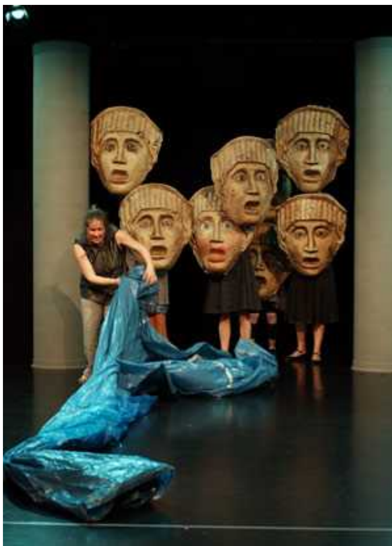
Ensemble Materialtheater, Stuttgart: Der Garten