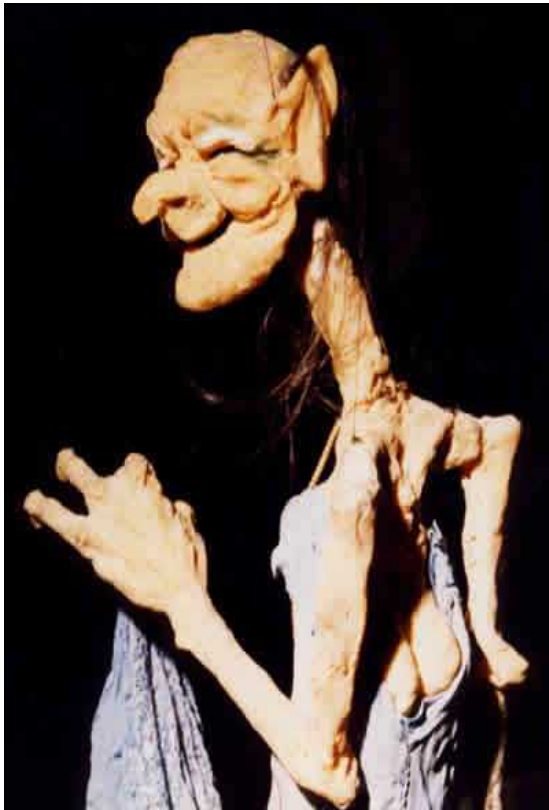
figuren theater tübingen „Hexen“

Das FITZ! Zentrum für Figurentheater ist eines der bedeutenden europäischen Spiel- und Produktionsorte für zeitgenössisches Figurentheater. Bereits in den 60er Jahren war Stuttgart die Heimat zahlreicher Figurentheaterensembles mit verschiedenen Spielstätten. 1983 folgten zwei entscheidende Schritte für die besondere Entwicklung dieser Kunst in der Landeshauptstadt: Mit dem FITZ entstand - bundesweit einmalig - eine feste Spielstätte für diese Theatersparte. Zeitgleich wurde an der Staatlichen Hochschule für Musik und Darstellende Kunst Stuttgart der Studiengang Figurentheater eingerichtet, der 2011 personell noch einmal deutlich erweitert wurde. Damit war der Grundstein für eine in Deutschland einmalige reiche und vitale Figurentheater-Szene gelegt.