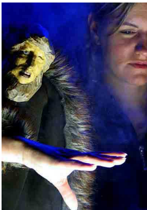
Figurentheater PARADOX & TheaterFusion, „Odin“

Zu Beginn des neuen Jahrtausends bewegen sich vor allem die jungen Theatermacher verstärkt auf die anderen Künste und die Neuen Medien zu. Sie definieren ihr künstlerisches Selbstverständnis nicht mehr im Kontext herkömmlicher Inszenierungs- und Aufführungstraditionen. Bildende Kunst, Performance Art, Musik, Film, Video werden in ästhetische und inhaltliche Strategien eingebunden, die interdisziplinärem Denken entspringen und unbefangen zu verschiedensten künstlerischen Ausdrucksweisen vereinigt.