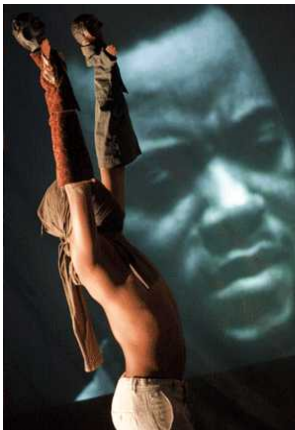
Cie. Kazyadance (DK/F) „Congo, my body“

Dies liegt an dem ungeheuren Potential an künstlerischer Veränderung und Weiterentwicklung, die im Figurentheater steckt, und an der inspirierenden Kraft, die von diesem Genre ausgeht. Der Fundus dieser virtuosen Kunst reicht vom zerknüllten Papier bis zur filigranen Marionette, von Masken bis zu Licht, Raum und Schatten, von der Stabpuppe bis zum Alltagsobjekt. Grenzüberschreitungen zu Schauspiel, Musik, Tanz und Pantomime sind inzwischen selbstverständlich und machen Figurentheater zu einer sehr zeitgemäßen Kunstform.