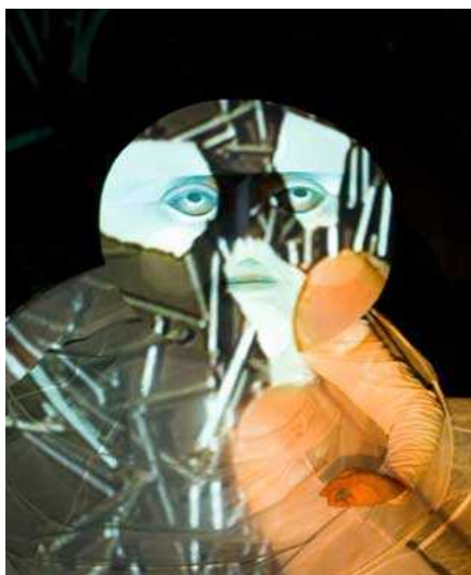
Wanke Ensemble, Stuttgart „carambolage“

Ein wichtiger Schwerpunkt des FITZ-Programms ist die Nachwuchsförderung. So werden bei den im zweijährigen Turnus organisierten „NEWZ - Forum des Jungen Figurentheaters“ Arbeiten von Studenten und Absolventen des Stuttgarter und Berliner Ausbildungsgangs gezeigt. Auch während der Spielzeit bietet das FITZ immer wieder Programmplätze für die Arbeiten von jungen Künstlern.