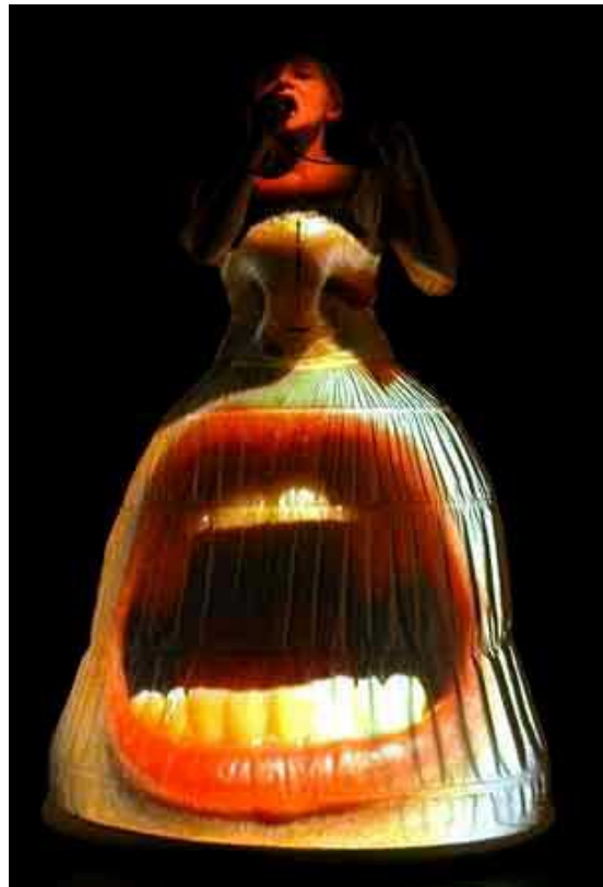
Iris Meinhardt, „Intimitäten“

Gegenwärtig präsentiert das FITZ jährlich in 280 Vorstellungen ca. 40 unterschiedliche Produktionen regionaler, deutscher und internationaler Figurentheaterbühnen.